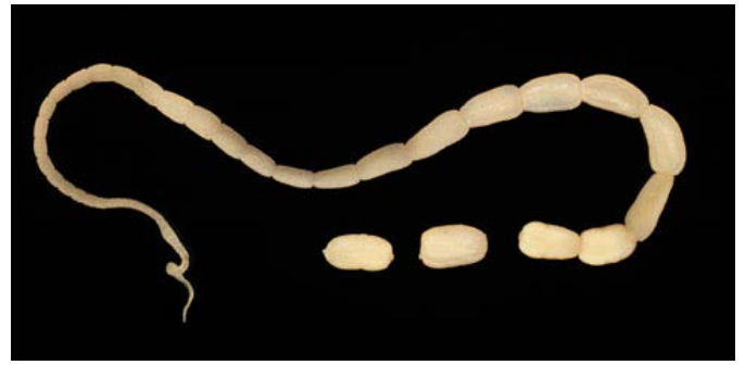
Dipylidium D. caninum ex dog. Given by Peter Schantz (Public domain)

Une autre conséquence de la présence de puce est l'infestation par le Dipylidium Caninum . Ce ver digestif fait partie de la famille des cestodes, ou vers plats, famille à laquelle appartient aussi le tænia .