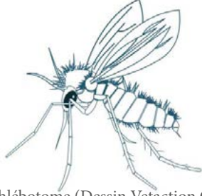
Phlébotome (Dessin Vetaction Conseil)

Ces petits insectes piqueurs très proches des moustiques sont présents en particulier dans le sud de la France . Ils transmettent en particulier les leishmanies, des parasites microscopiques responsables de la leishmaniose chez le chien.